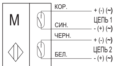
Схема подключения нагрузки